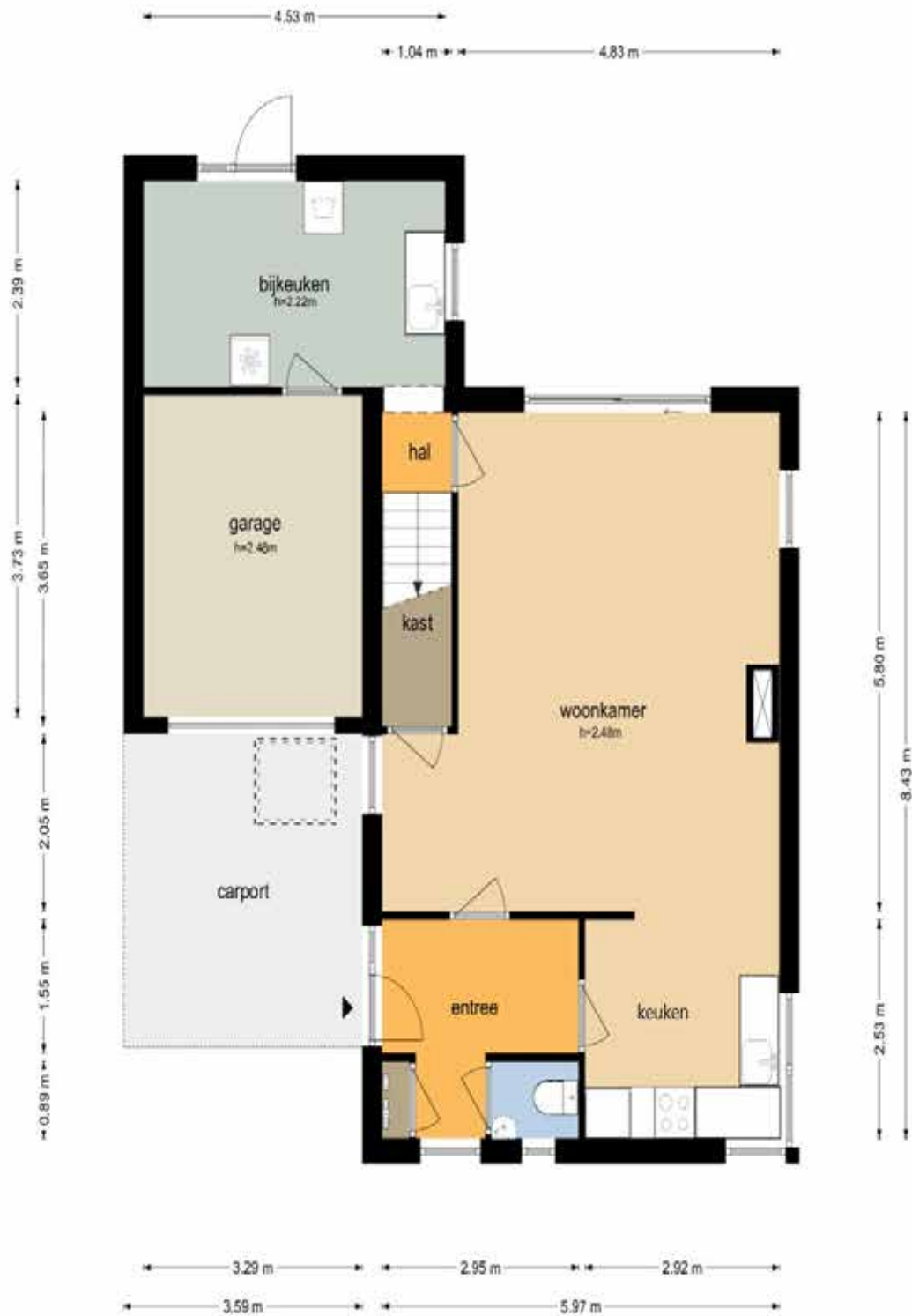
Julia Culpstraat 64 - Hengelo Begane Grond

De plattegronden zijn geproduceerd voor promotionele doeleinden en ter indicatie. Aan de plattegronden kunnen geen rechten worden ontleend.